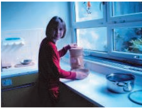
1/2kg Roggen mahlen.

Das Mehl mit 1 1/2 P. Backpulver, 2 Tl. Salz, 1 Tl. Brotgewürz, 1/2 l Buttermilch und 1/8 l Milch in einer Schüssel verrühren. Aus dem weichen Teig Weckerl stechen, in Mehl wälzen, auf ein mit Backpapier belegtes Blech legen.