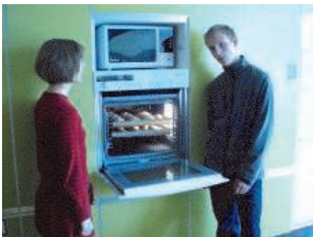
Bei 180° ca. 30 min backen.

Auskühlen lassen und gemeinsam genießen.